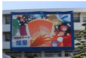
〈筑前祭…巨大モザイクアートと書道部〉