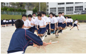
自立と協働を学ぶ 体験活動