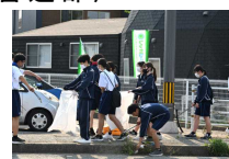
〈地域ボランティア活動〉

通学路の清掃と周船寺川の環境保全を目的に本校が30年以上続けている活動です。昨年度からは九州大学の学生も参加して一緒に活動しています。