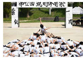
〈体育祭…創作ダンス〉